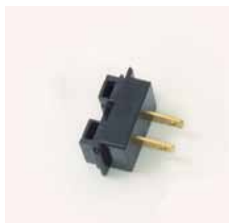
6 Art.-Nr. E/1543.045143 Ladegerät-Adapter Stecker USA