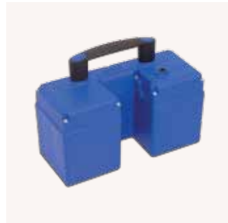
3 Art.-Nr. E/1543.004150 Schnellwechselakku