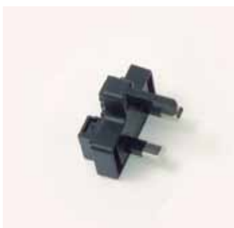
5 Art.-Nr. E/1543.045142 Ladegerät-Adapter Stecker UK