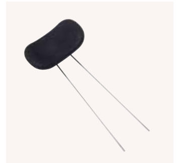
4 Art.-Nr. E/1543.945101 Kopfstütze