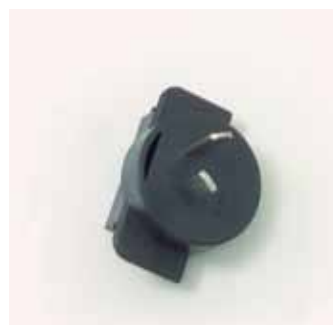
7 Art.-Nr. E/1543.045144 Ladegerät-Adapter Stecker AUS