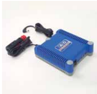
2 Art.-Nr. E/1543.945120 KfZ-Ladegerät