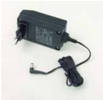
1 Art.-Nr. E/1543.045141 Netzladegerät