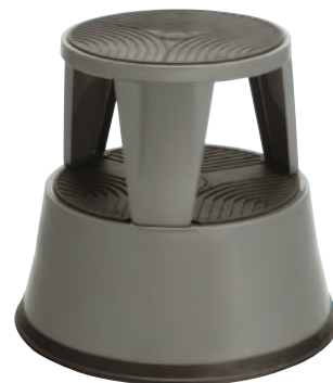
Art. n° M/895-29