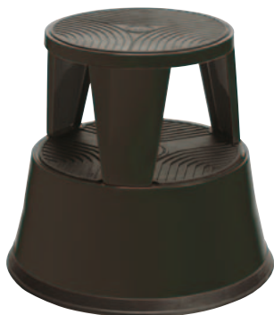
Art. n° M/895-11

Disponible en différentes couleurs : Article n° M/895-xx (conformément aux couleurs mentionnées ci-dessous)