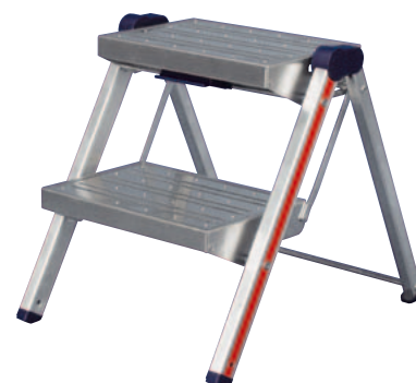
Art. n° M/6030/02 naturel