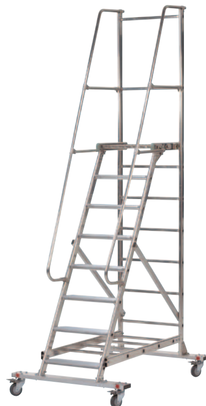
Art. n° M/FT19604 Escaroul 8 marches y.c. plate-forme

Attention : Largeur extérieure L, ajouter 6 cm pour rotation roulette !