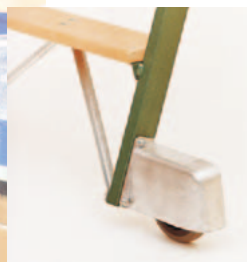
Roulette d'appui au sol