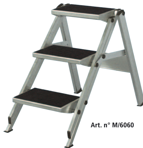
Art. n° M/6060