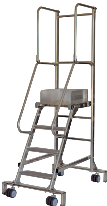
Art. n° M/FT19604 Escaroul 4 marches y.c. plate-forme