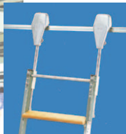
Guidage mouvement latéral