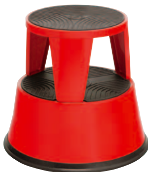
Art. n° M/895-12