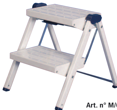
Art. n° M/6031/02 blanc