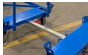
EasySTOP löst sich von selber