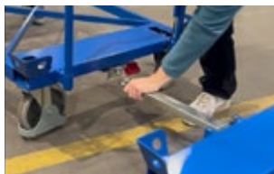
an Kupplung ziehen