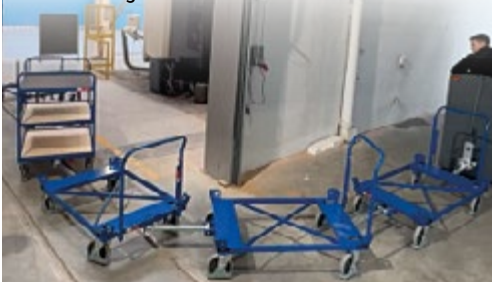
VORHER: Zugfahrzeug mit Kupplung

Das VARIOfit -Team montiert an Ihrem Zugfahrzeug eine Adapterdeichsel. Nutzen Sie Ihre Fläche komplett aus und profitieren Sie von schneller Intralogistik.