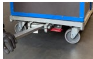
EasySTOP löst sich von selber