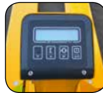
Tastenfeld / Digitalanzeige